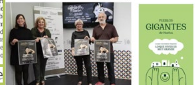
Presentación informativa del Festival Solidario HelpMePlease en el Ayuntamiento de Granada.

El Festival Solidario HelpMePlease de Granada reúne 14 iniciativas culturales desde música y circo a debates